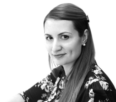
Ольга Стефанишина, заступниця Міністра охорони здоров'я

Ще один важливим кроком є утворення централізованої закупівельної організації — ДП «Медичні закупівлі України». Саме вона має впровадити професійні стандарти і процедури, щоб поширити досвід прозорих ефективних закупівель через міжнародні організації на закупівлі ліків на місцевому рівні. Підприємство вже починає закуповувати ліки та медичні вироби за кошти гранту Глобального фонду для боротьби зі СНІДом, туберкульозом та малярією. Триває робота над створенням пілотного проекту електронного каталогу, який дасть можливість лікарням та іншим державним закладам